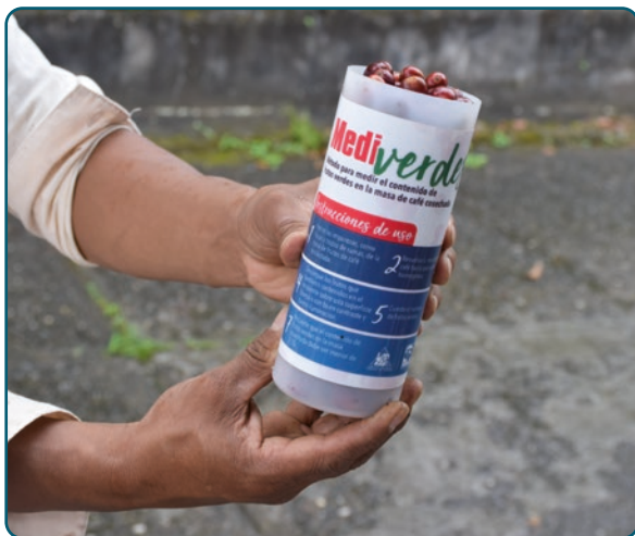
Figura 3. Recipiente del método Mediverdes de 600 mL.

La cosecha asistida es un concepto que promueve la Federación Nacional de Cafeteros de Colombia para que la recolección de café sea más eficiente, de tal manera que a la vez puedan beneficiarse los caficultores y los recolectores. Esto implica la adopción de tres prácticas: retención de pases, recolección manual con lonas y uso de la Derribadora DSC 18 (Sanz et