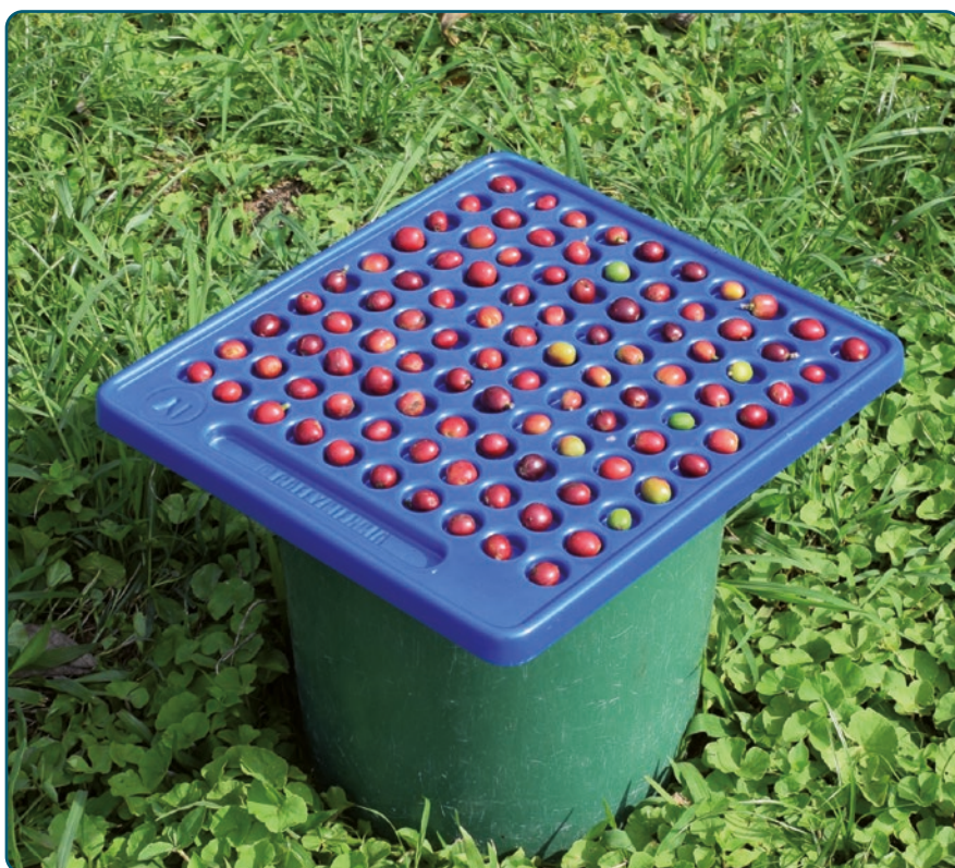
Figura 1. Tabla de las 100 cavidades para determinar porcentaje de frutos verdes en la cosecha.

Con los datos obtenidos, se construyó la gráfica de la Figura 2, en la que se describe el comportamiento del error de medición, observándose que a medida que aumenta la masa, disminuye el porcentaje de error, y que a partir de los 0,325 kg , el error tiene un comportamiento estable en un valor aproximado a \pm 0,7\% y con una variación del 1,5%.