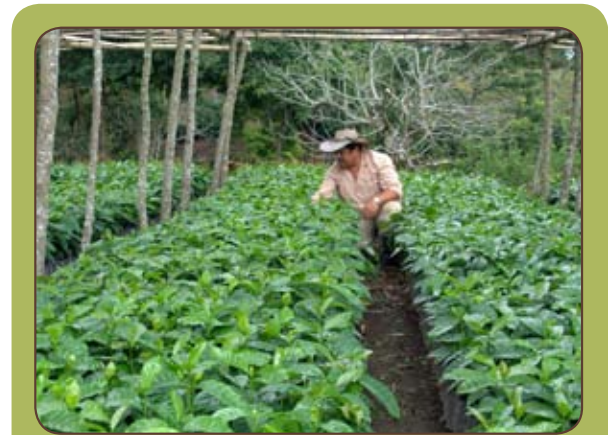
Figura 4. Monitoreo de la presencia de cochinillas harinosas en almácigos de café.