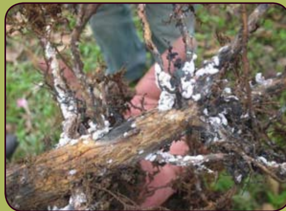
Figura 3. Sistema radical de una planta de café con presencia de Ceratocystis fimbriata y cochinillas harinosas.

Entre las cochinillas harinosas que se han observado recientemente asociadas a las raíces del café ocasionando daños económicos se encuentran: