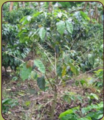
Figura 2. Caída prematura de los frutos debido al ataque de las cochinillas.

Asociadas a estas cochinillas se han registrado 19 géneros de hormigas, entre las que se encuentran con mayor frecuencia: Solenopsis geminata (Fabricius), Pheidole sp., Brachymyrmex sp., Wasmania auropunctata (Roger), Acropyga exanguis (W.M. Wheeler) y A. fuhrmanni (Forel) y Tranopelta gilva Mayr. Los otros géneros de hormigas corresponden a: Hypoponera , Prionopelta , Crematogaster , Linepithema , Odontomachus , Paratrechina , Cyphomyrmes , Monomorium , Heterogonera , Strumigenys , Carebara , Mycocccpuros , Typhlamyrmex .