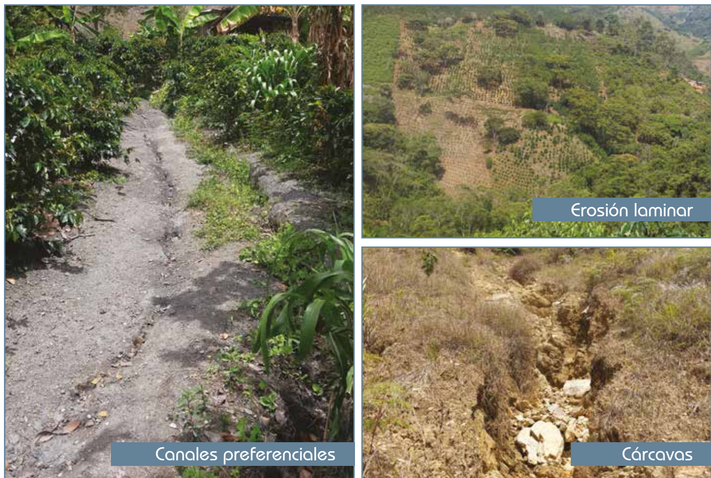
Figura 1. Fases de erosión hídrica.