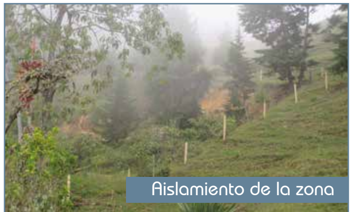
Figura 5. Prácticas recomendadas en prevención de movimientos en masa.