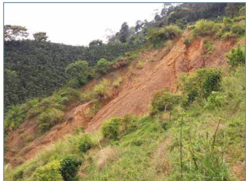
Figura 3. Movimiento en masa que afecta el área productiva.

De estos factores, el clima es el principal activador de movimientos en masa en períodos de altas precipitaciones (9). Sin embargo, además de los factores ya mencionados, es importante considerar los factores antrópicos, como los tanques con fugas, mangueras rotas, disposición inadecuada de aguas domésticas, falta de mantenimiento de los canales para conducción de aguas lluvias, mal trazado de las vías y líneas de conducción de acueductos en mal estado, entre otros (2).