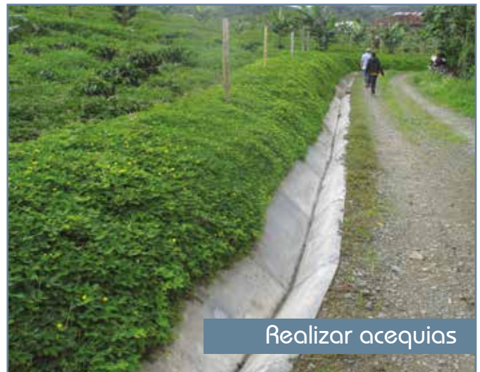
Figura 4. Prácticas recomendadas en conservación de suelos.