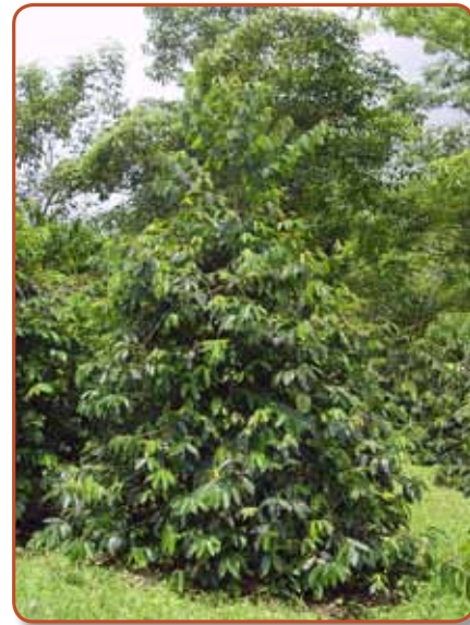
Figura 3. Híbrido de Timor.

El número de cosechas depende de la localización de la finca y la distancia de siembra. No es lo mismo tener un cafetal sembrado a 1,0 x 2,0 m que un cafetal a 1,0 x 1,0 m. Con esta última distancia, pueden recolectarse tres cosechas, mientras que a mayor distancia es posible recolectar cuatro y hasta cinco cosechas, cuando el cafetal se encuentra en zonas por encima de 1.600 m, porque el crecimiento es más lento debido a la menor luminosidad.