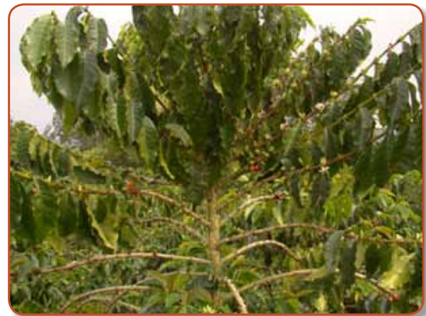
Figura 2. Plantas de Variedad Castillo® con hojas en posición vertical.

Son el resultado de una selección de componentes específicos (líneas), que tienen un comportamiento agronómico y productivo sobresaliente en determinadas zonas cafeteras con características similares de clima y suelo, también llamados Ecotopos. Como resultado de esta selección se conformaron siete mezclas de componentes, para igual número de zonas agroclimáticas