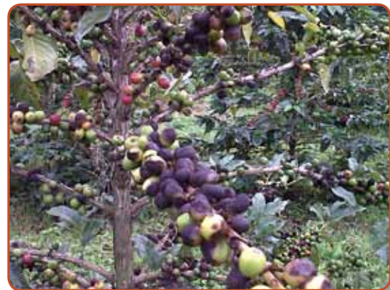
Figura 7. Síntomas de la enfermedad de las cerezas del café ( Colletotrichum kahawae ).