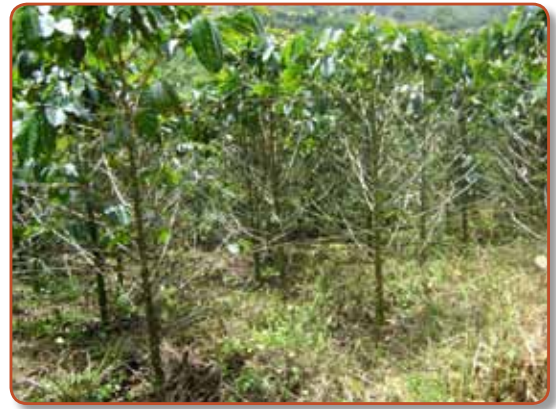
Figura 6. Costa Rica 95 con roya en Andes (Antioquia).

fue considerada como de mala calidad en taza. Esta característica así como el hecho de provenir de una sola línea resistente a la roya son sus principales desventajas. Actualmente, en algunas zonas del país, se ha observado ya una pérdida de su resistencia (Figura 6).