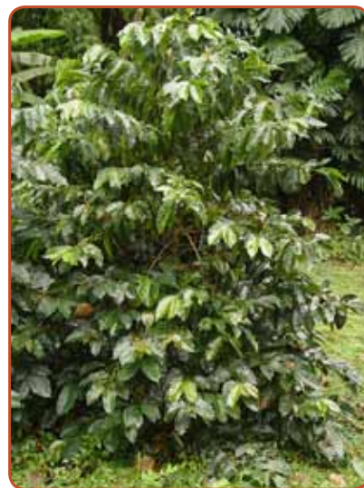
Figura 4. Planta tipo de la Variedad Castillo®.

Al igual que la variedad Colombia, la Variedad Castillo® conserva las características de la especie a la que pertenece ( Coffea arabica ), entre ellas, la excelente calidad de bebida (Figura 4).