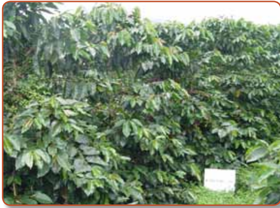
Figura 5. Costa Rica 95.