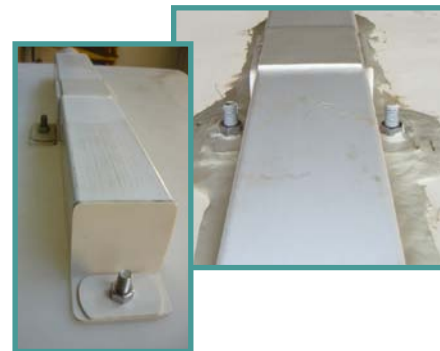
Figura 2. Instalación del dispositivo de evacuación para retirar las aguas mieles de lavado del grano en el tanque tina.

Lo ideal es que cada tanque cuente con un volumen libre equivalente al 30% de la capacidad total del mismo.