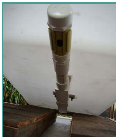
Figura 4. Fondo externo del tanque tina. Se aprecia la válvula de salida de las aguas mieles.

Cuarto enjuague. Adicione agua hasta que su nivel esté entre 5 y 10 cm por encima de la masa de café. Agite fuertemente y retire los flotes remanentes. Descargue el residuo al SMTA (Figura 4). Las mieles del