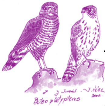
♂ Juvenil - J. Pérez 2004 Buteo platypterus

Su zona de invernación se extiende desde el sur de México hasta Bolivia y el norte de Brasil.