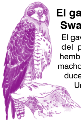
Buteo Swainsoni - Arlt 07

Luego regresan al norte en marzo y abril.