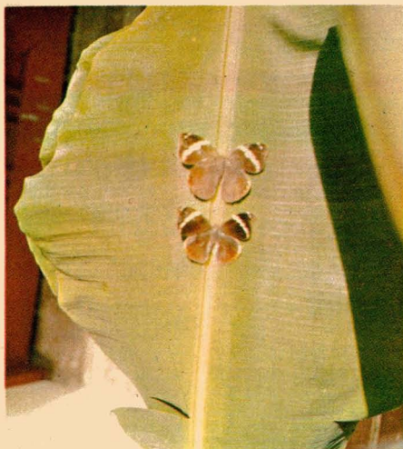
Mariposas del gusano cabrito. La mariposa hembra es de ma- yor tamaño.