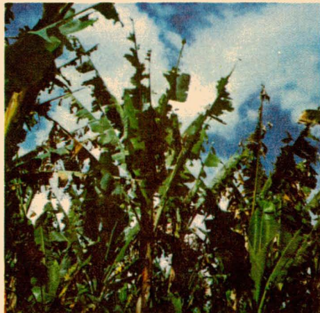
Cultivos atacados por el gusano cabrito