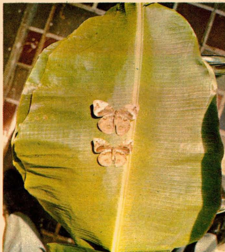
Mariposas del gusano cabrito vistas por debajo.