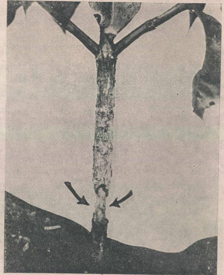
Las flechas muestran el anillo que hizo el gusano alrededor del tallo.