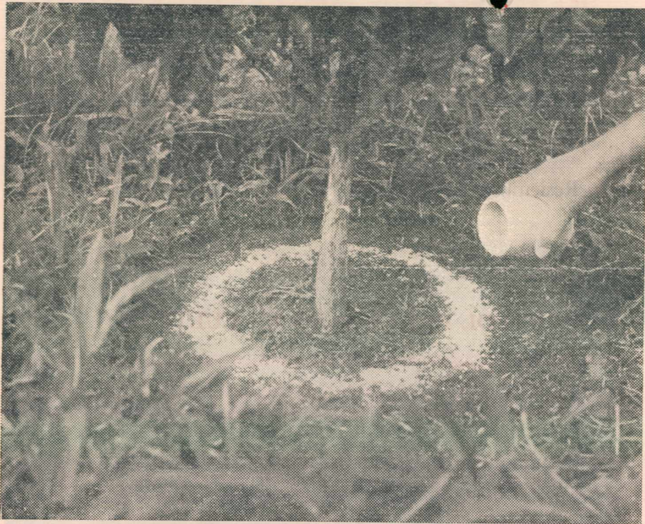
Forma como se debe aplicar el fertilizante mezclado con el Dipterex o con el Cebicid.