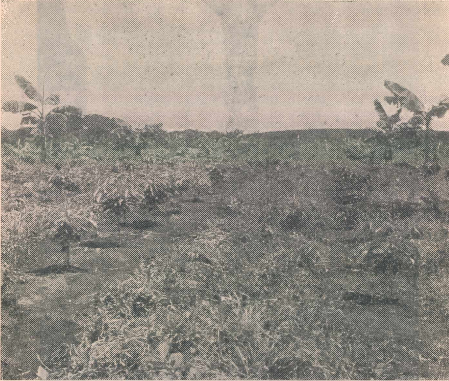
Forma como se deben hacer las desyerbas