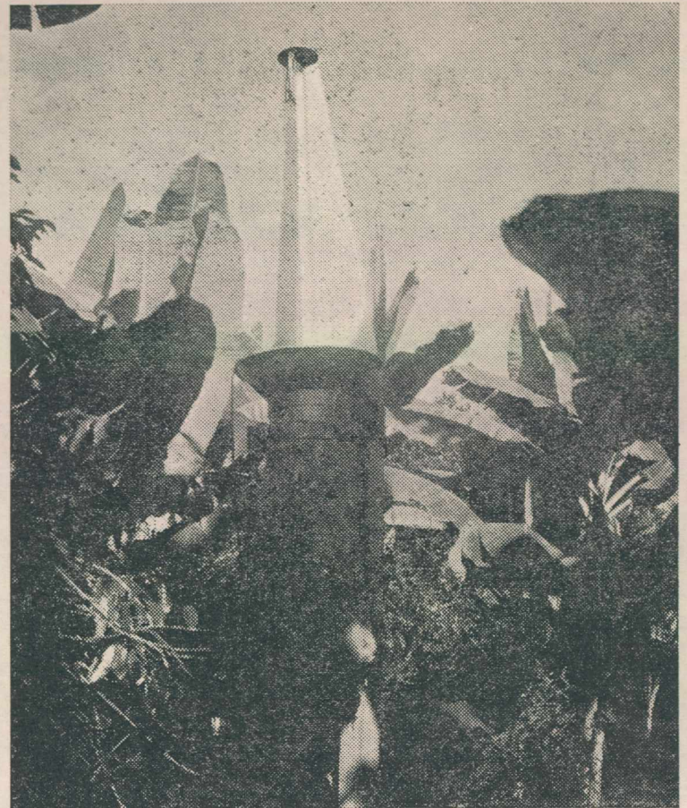
Lámpara de luz negra.