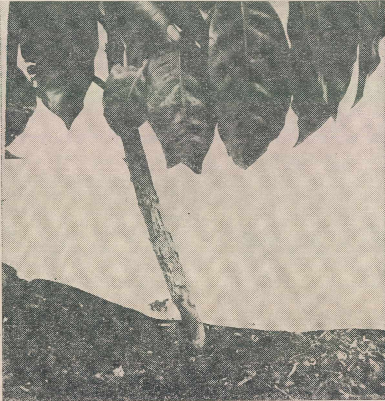
Cafeto atacado e inclinado.