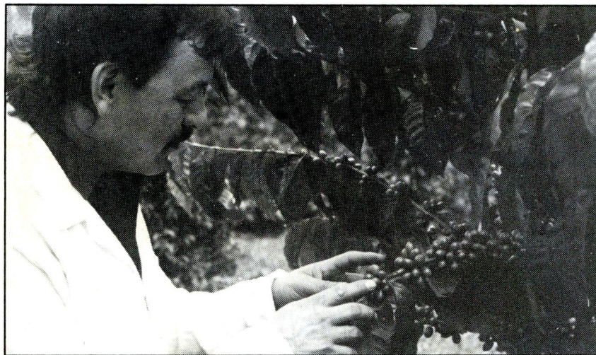
La evaluación del porcentaje de infestación se debe hacer luego del RE - RE.