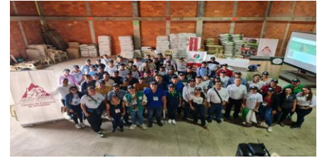
Valle de San José - Santander