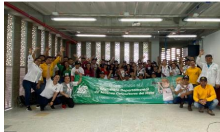
Granada - Meta

1.400 jóvenes atendidos al final del 2023