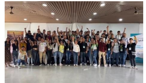
Pereira - Risaralda