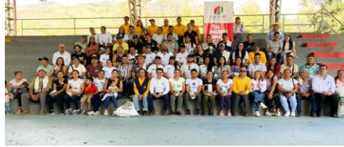
Chaguaní - Cundinamarca