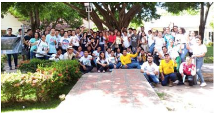
Fonseca - Guajira