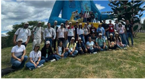
Gigante - Huila