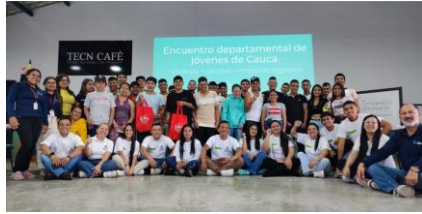
Popayán - Cauca