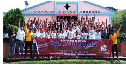
Santa Rosa del Sur - Bolívar