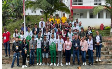
Buenavista - Boyacá