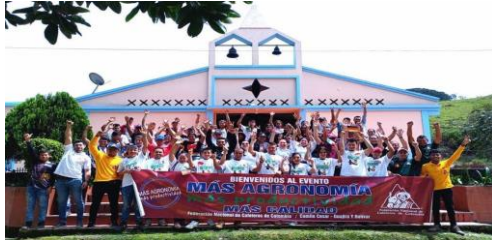
Santa Rosa del Sur - Bolívar