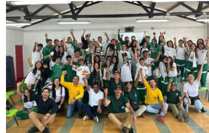
Jardín - Antioquia