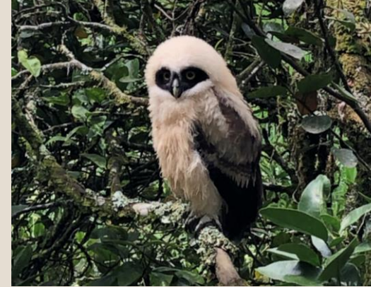
Aumentar la biodiversidad