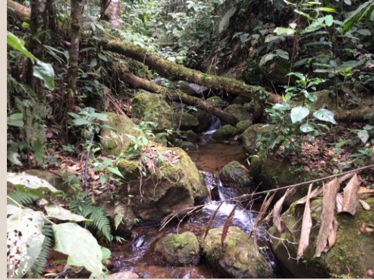
Mejorar la calidad del agua