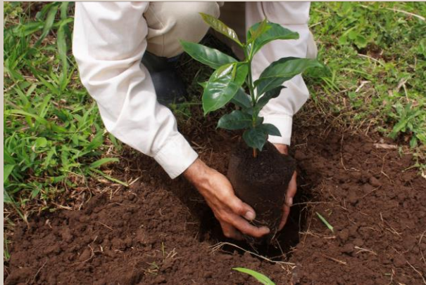
Mejorar la salud del suelo