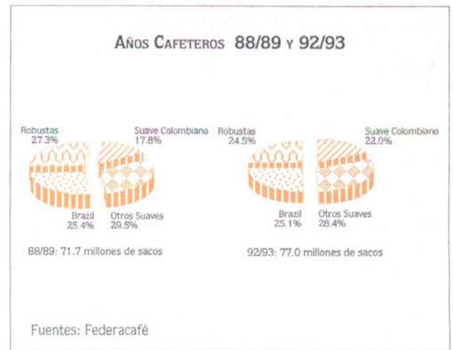
GRÁFICO: EXPORTACIONES MUNDIALES POR TIPOS DE CAFE

Los países productores exploraron alternativas y mecanismos hasta agotar los intentos para revitalizar el Acuerdo Internacional del Café, sin demostrar los países consumidores apoyo alguno. Se necesitó acortar la duración de la crisis y anticipar la recuperación del precio, la cual fue inevitable, debido al deterioro de los cultivos del café y del poco nivel de aquellos que dependían de ellos. Los productores no tuvieron otra alternativa que reducir los embarques para aumentar el valor de su café en el mercado. Al mismo tiempo las cosechas empezaron a decaer. Después de 4 años de crisis, los inventarios estuvieron sensiblemente reducidos y concentrados en Brasil y Colombia, lo cual hizo un manejo más armonioso de la situación.