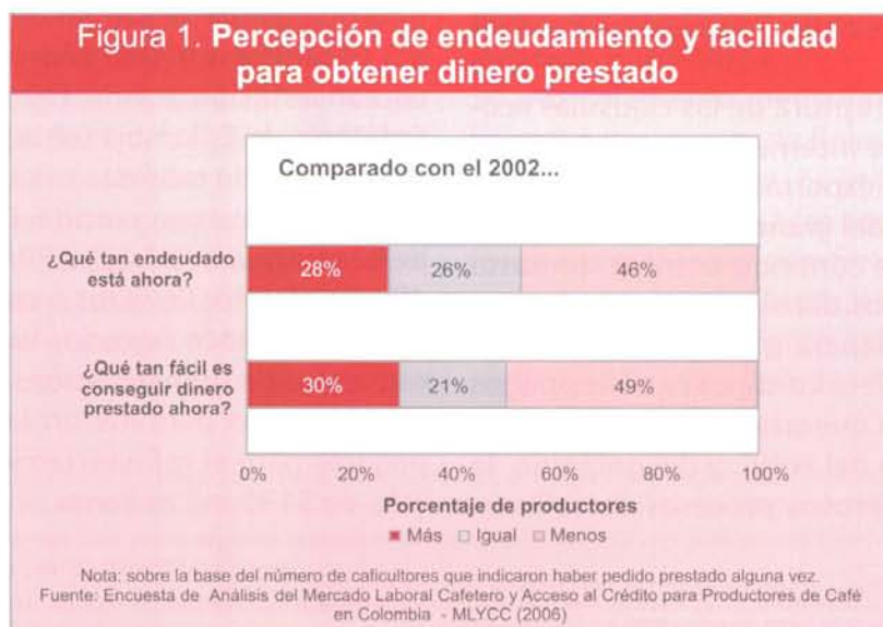
Figura 1. Percepción de endeudamiento y facilidad para obtener dinero prestado

En general los caficultores que han solicitado créditos alguna vez, se sienten ligeramente menos endeudados que en la época de crisis cafetera