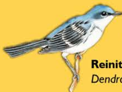
18. Reinita Cerúlea Dendroica cerulea