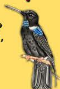
8. Inca Negro Coeligena prunellei