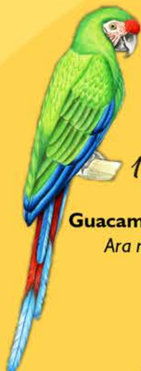
12. Guacamaya Verde Ara militaris