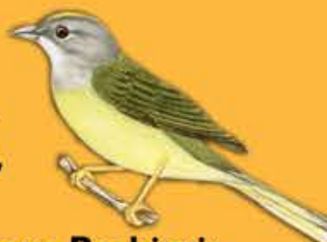
26. Arañero Pechigris Basileuterus cinereicollis