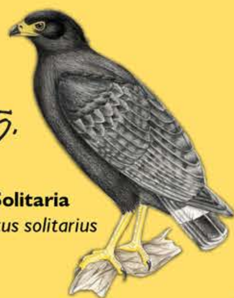
5. Aguila Solitaria Harpyhaliaetus solitarius