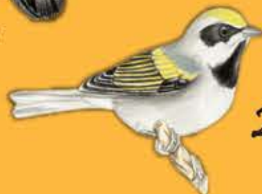
25. Reinita Alidorada Vermivora chrysoptera