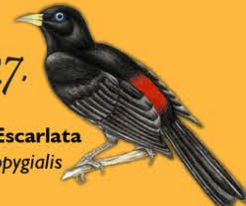
27. Arrendajo Escarlata Cacicus uropygialis

Localidades donde Cenicafé ha registrado especies en el Libro Rojo