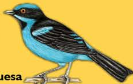
16. Dacnis Turquesa Dacnis hartlaubi