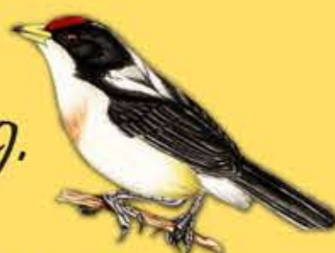
9. Torito Capiblanco Capito hypoleucus