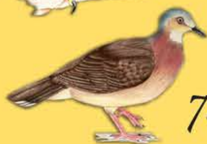
7. Caminera Tolimense Leptotila conoveri