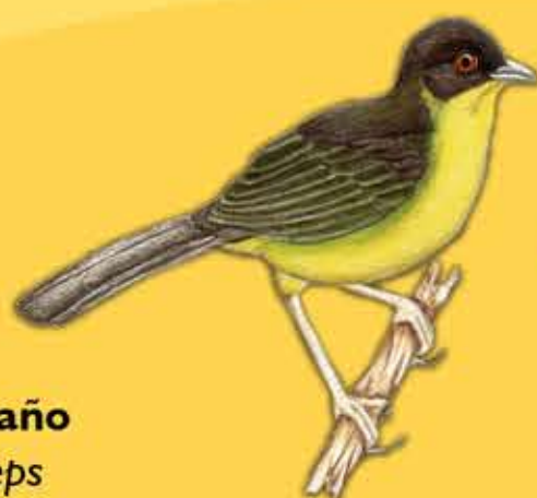
17. Atlapetes Oliváceo Atlapetes fuscolivaceus