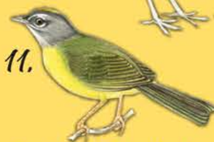
11. Arañero Embridado Basileuterus conspicillatus