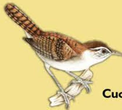
3. Cucarachero de Nicéforo Thryothorus nicefori