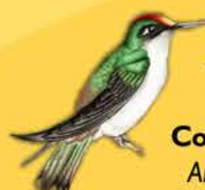
14. Colibrí Cabecicastaño Anthocephala floriceps