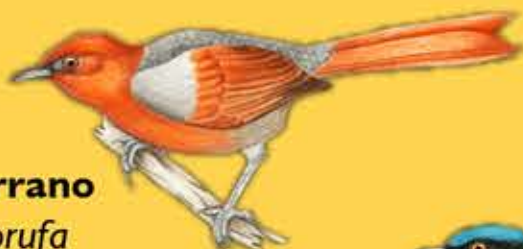
15. Rastrojero Serrano Synallaxis fuscorufa