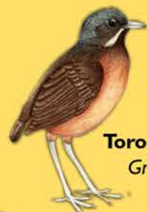
10. Tororoi Bigotudo Grallaria alleni