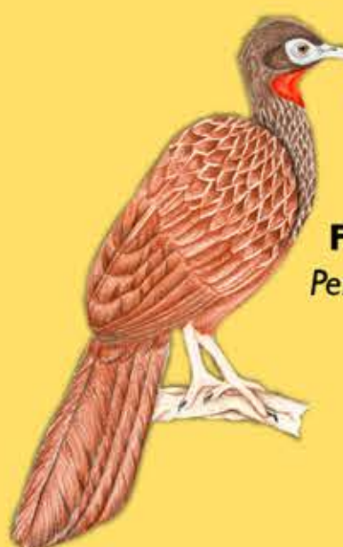
4. Pava Caucana Penelope perspicax