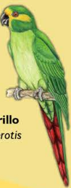
2. Loro Orejamarillo Ognorhynchus icterotis