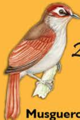
22. Musguero de Anteojos Siptornis striaticollis