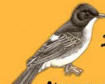
23. Atrapamoscas Boreal Contopus cooperi