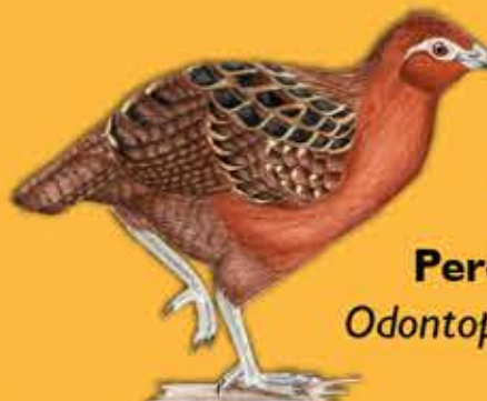
21. Perdiz Colorada Odontophorus hyperythrus