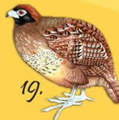
19. Perdiz Carinegra Odontophorus atrifrons