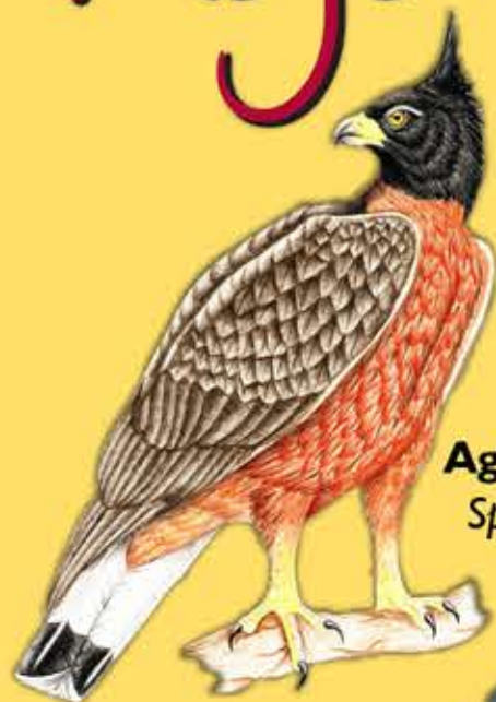
6. Aguila Crestada Spizaetus isidori