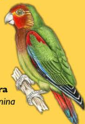
13. Cotorra Montañera Hapalopsittaca amazonina