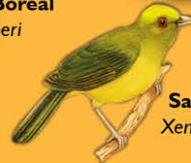
24. Saltarín Dorado Xenopipo flavicapilla