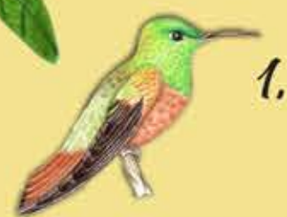
1. Amazilia Ventricastaño Amazilia castaneiventris