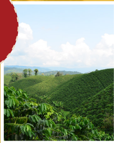
CAFÉ AL SOL