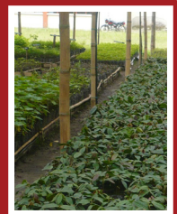
ALMÁCIGOS DE SOMBRÍO