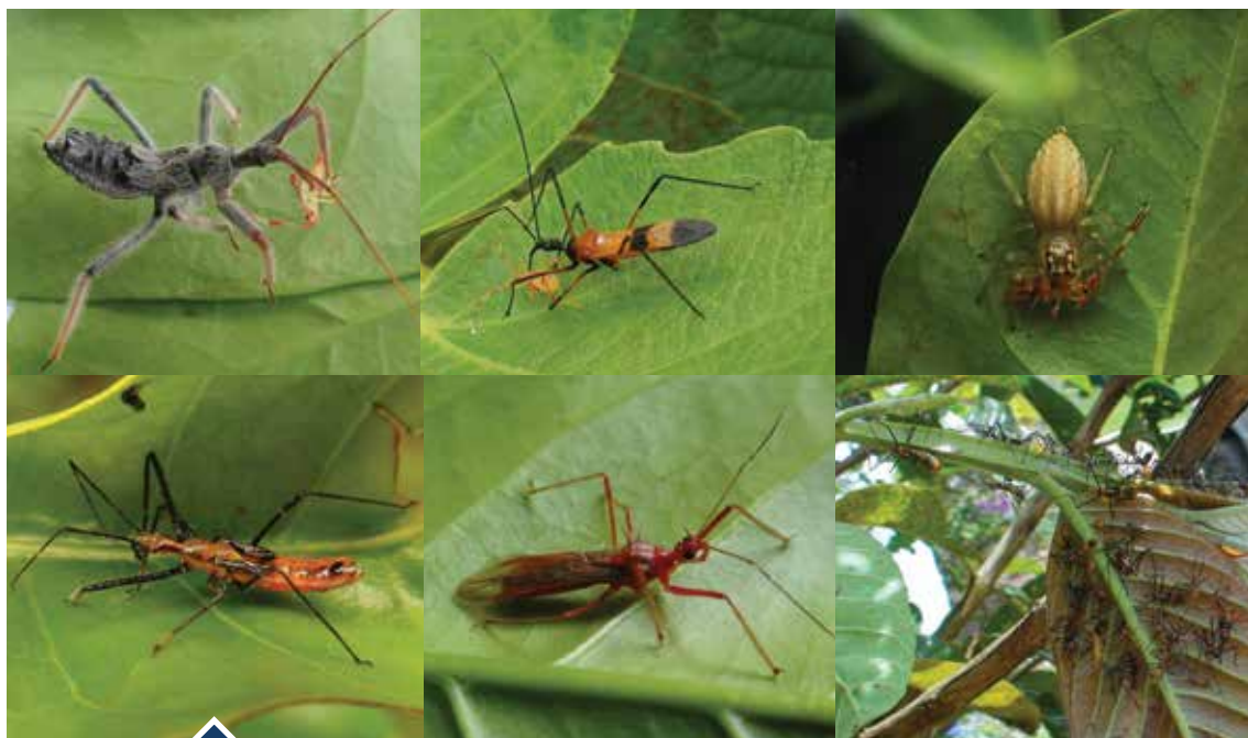
Depredadores naturales de Monalonion velezangeli .

Para el diagnóstico y manejo de la chinche de la chamusquina revise los cafetales periódicamente para detectar oportunamente los daños frescos en los brotes nuevos, flores, tallos en formación y frutos; realice el control en los focos. Esta plaga presenta un número importante de depredadores que afectan sus poblaciones de manera natural, de tal manera que se recomienda evitar la aplicación generalizada de insecticidas de amplio espectro como los piretroides, con el fin de mantener el equilibrio biológico.