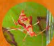
Ninfa Monalimon vellezangol

Los principales ataques por este insecto aparecen a la llegada de las épocas lluviosas en las regiones de Cauca, Huila y Valle del Cauca.