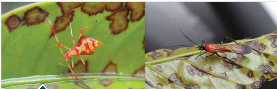
Chinche de la chamusquina del café, ninfa y adulto, atacando hojas de café en el campo.

Con la llegada de las lluvias esté vigilante para detectar la presencia de las cochinillas de las raíces del café y de la chinche de la chamusquina del café, Monalonion velezangeli . Recuerde que el mejor momento para realizar el diagnóstico y control de las cochinillas de las raíces del café, es con la llegada de la época de lluvia.