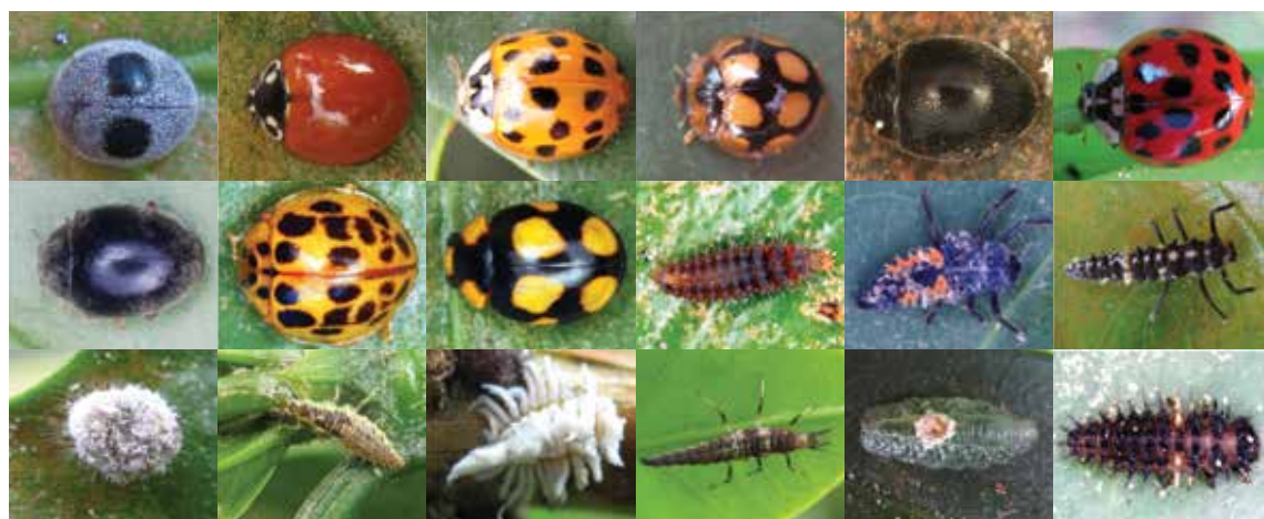
Adultos y larvas de los depredadores naturales de la araña roja.

El ataque ocurre de manera agregada, de tal manera que su control debe realizarse al inicio del tiempo seco, inmediatamente aparecen los primeros focos en el cafetal. Se recomienda aplicar acaricidas como spiromesifen en concentración de 1,5 cm 3 /L, exclusivamente a los árboles con daños en los focos. Esta recomendación localizada permite proteger un alto número de insectos depredadores enemigos naturales de la araña roja, entre otros como los coccinélidos Stethorus sp., Harmonia sp. y Cycloneda sanguinea . Las poblaciones de la araña roja generalmente disminuyen con la llegada de las lluvias.