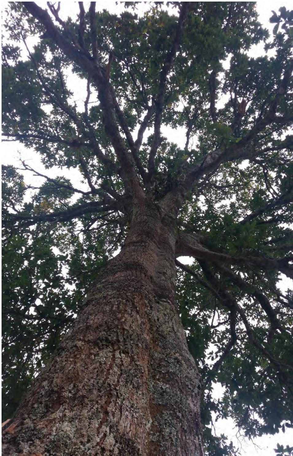
Roble, ( Quercus humboldtii ). [Ver galería pág. 157, 10-12]