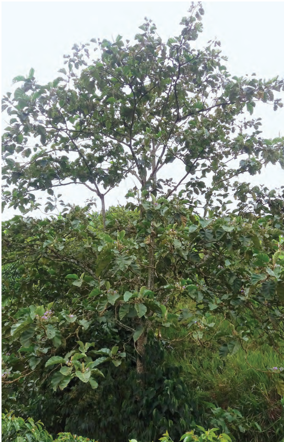
Tachuelo, ( Solanum sycophanta ). [Ver galería pág. 156, 1-3]