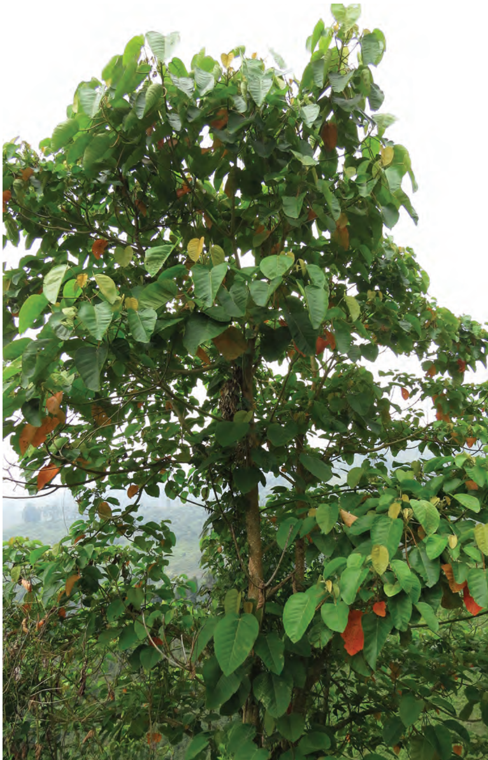
Drago, ( Croton magdalenensis ). [Ver galería pág. 159, 28-30]