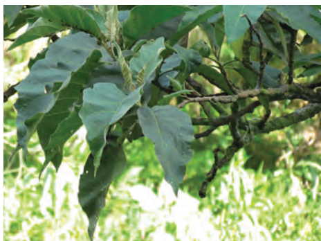
Tachuelo, ( Solanum sycophanta ). [1-3] Ver pág. 58