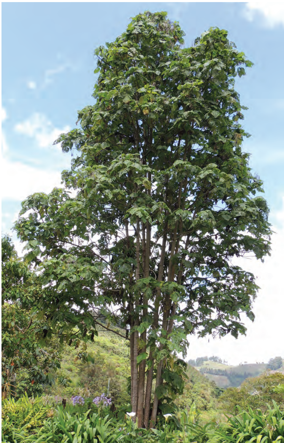
Arboloco, ( Montanoa quadrangularis ). [Ver galería pág. 156, 4-6]