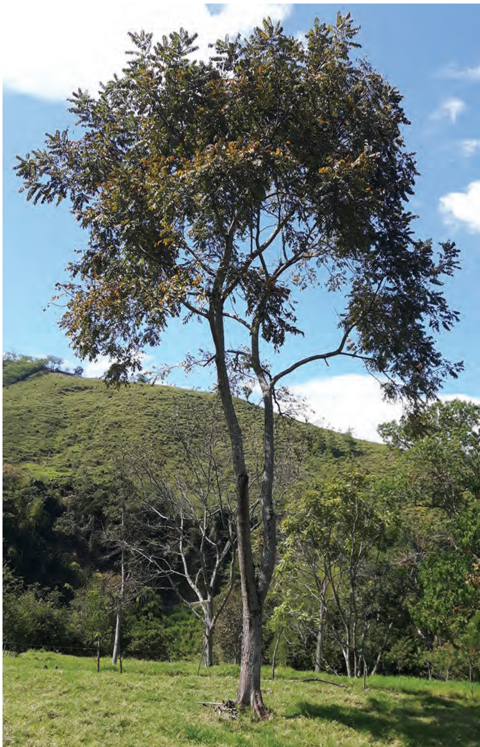
Cedro rosado, ( Cedrela odorata ). [Ver galería pág. 160, 36-38]