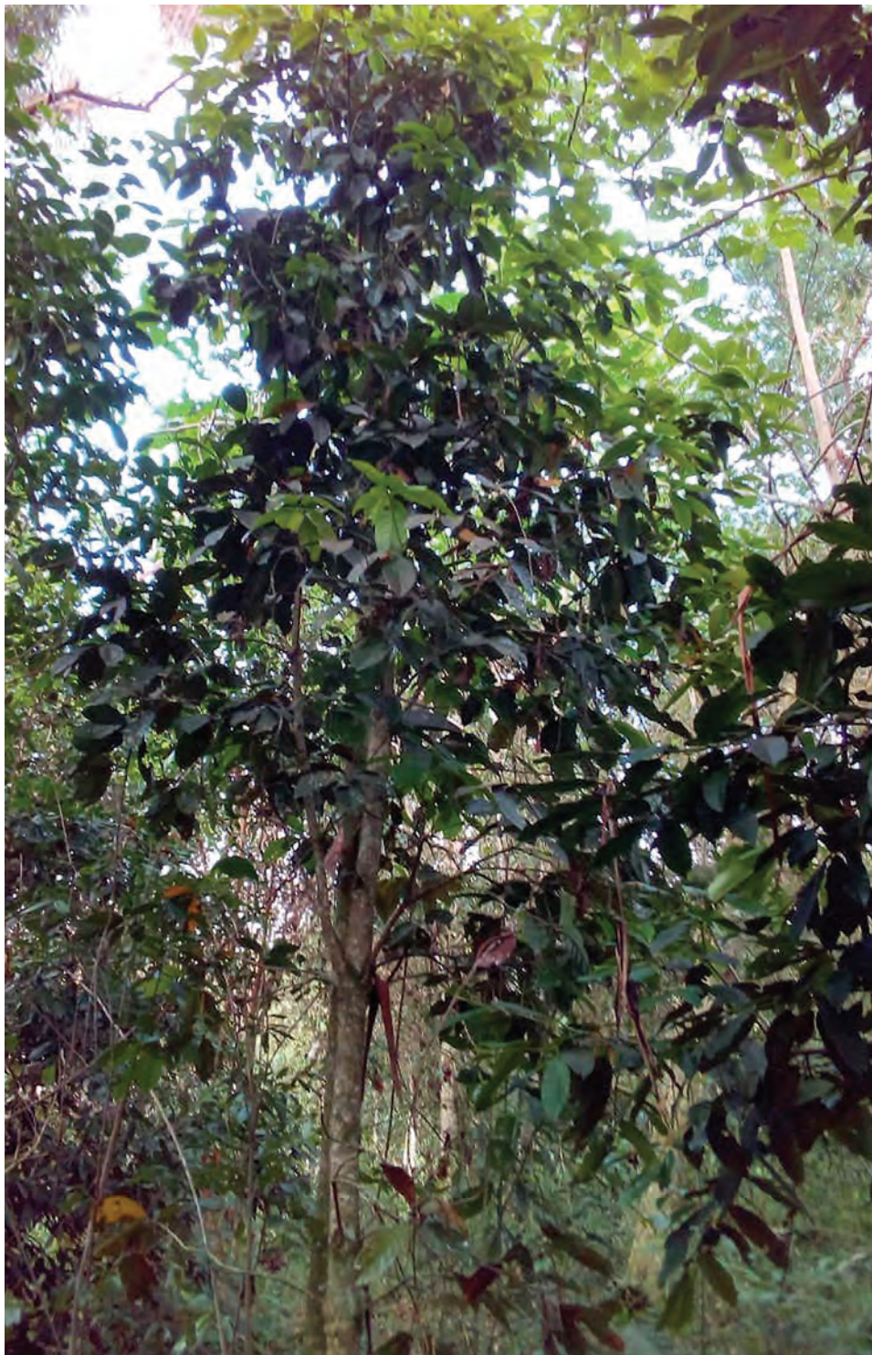
Nuquetoro, ( Persea rigens ). [Ver galería pág. 161, 45-46]