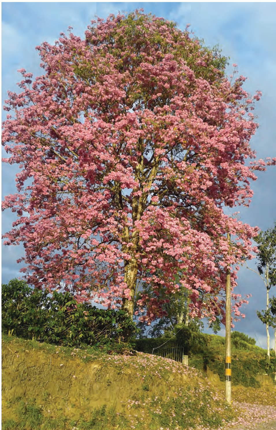
Guayacán rosado, ( Tabebuia rosea ). [Ver galería pág. 161, 41-44]