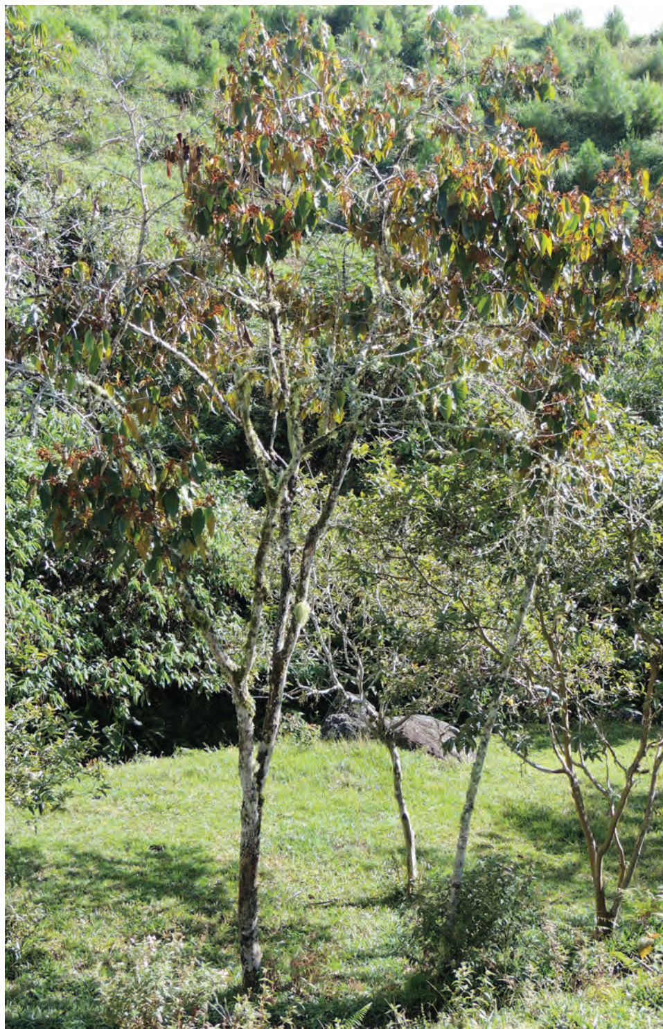
Punta de lanza, carate, ( Vismia baccifera subsp. ferruginea ). [Ver galería pág. 162, 55-58]