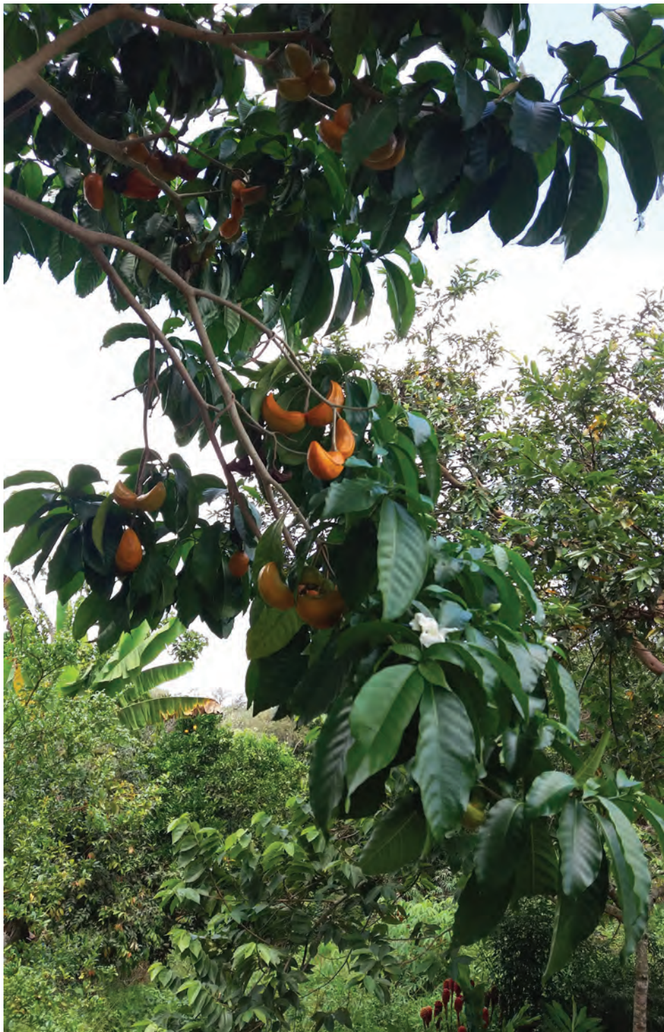
Azuceno, ( Stemmadenia litoralis ). [Ver galería pág. 163, 59-61]