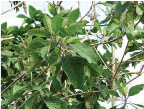
Camargo, ( Verbesina arborea ). [67-70] Ver pág. 146