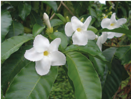
Azuceno, ( Stemmadenia litoralis ). [59-61] Ver pág. 140