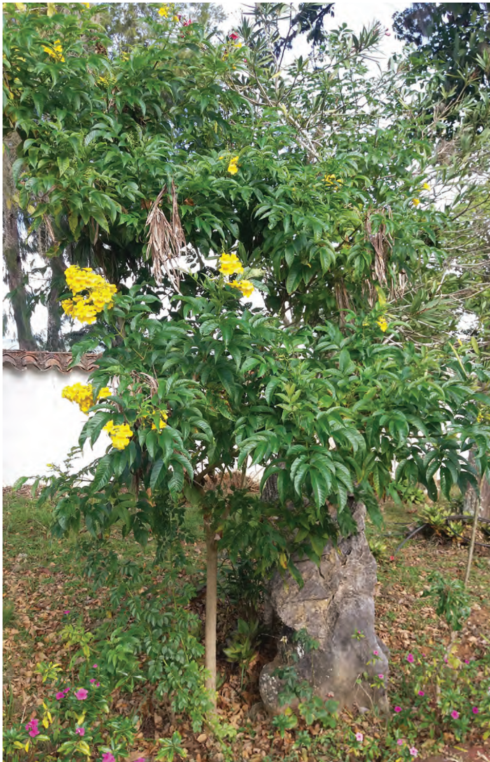
Chirlobirlo, ( Tecoma stans ). [Ver galería pág. 162, 50-54]