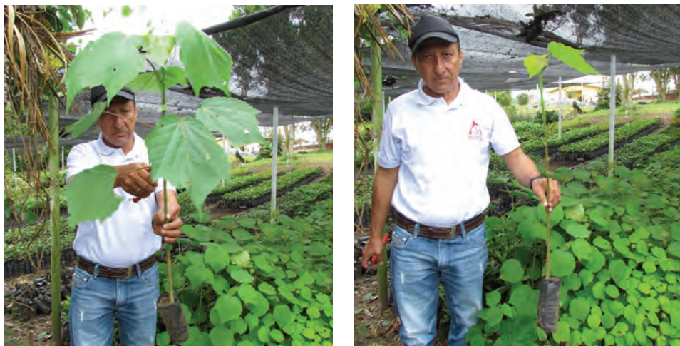
Estado inicial y final de la plántula durante el proceso de poda aérea.

sobrepasan en altura a las otras. No se recomienda realizar podas áreas para especies maderables o de uso comercial, debido a que la poda genera bifurcación de las ramas y cambios en la estructura del individuo. Entre las especies a las cuales se les puede hacer podas están el balso ( Heliocarpus americanus ), la leucaena ( Leucaena leucocephala ), el arboloco ( Montanoa quadrangularis ) y el zurumbo ( Trema micranthum ), debido a que alcanzan una altura de 1,0 a 1,2 m en seis meses. Debe tenerse en cuenta que estas podas se hacen cuando el fuste del individuo ya se encuentra bien desarrollado y siempre debe hacerse con tijeras, con buen filo y desinfectadas.