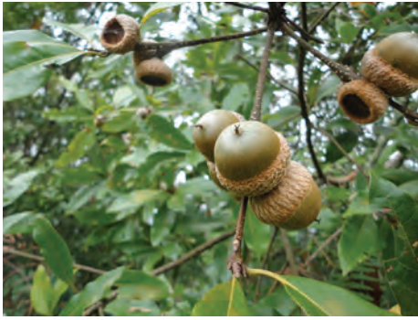
Roble, ( Quercus humboldtii ). [10-12] Ver pág. 74