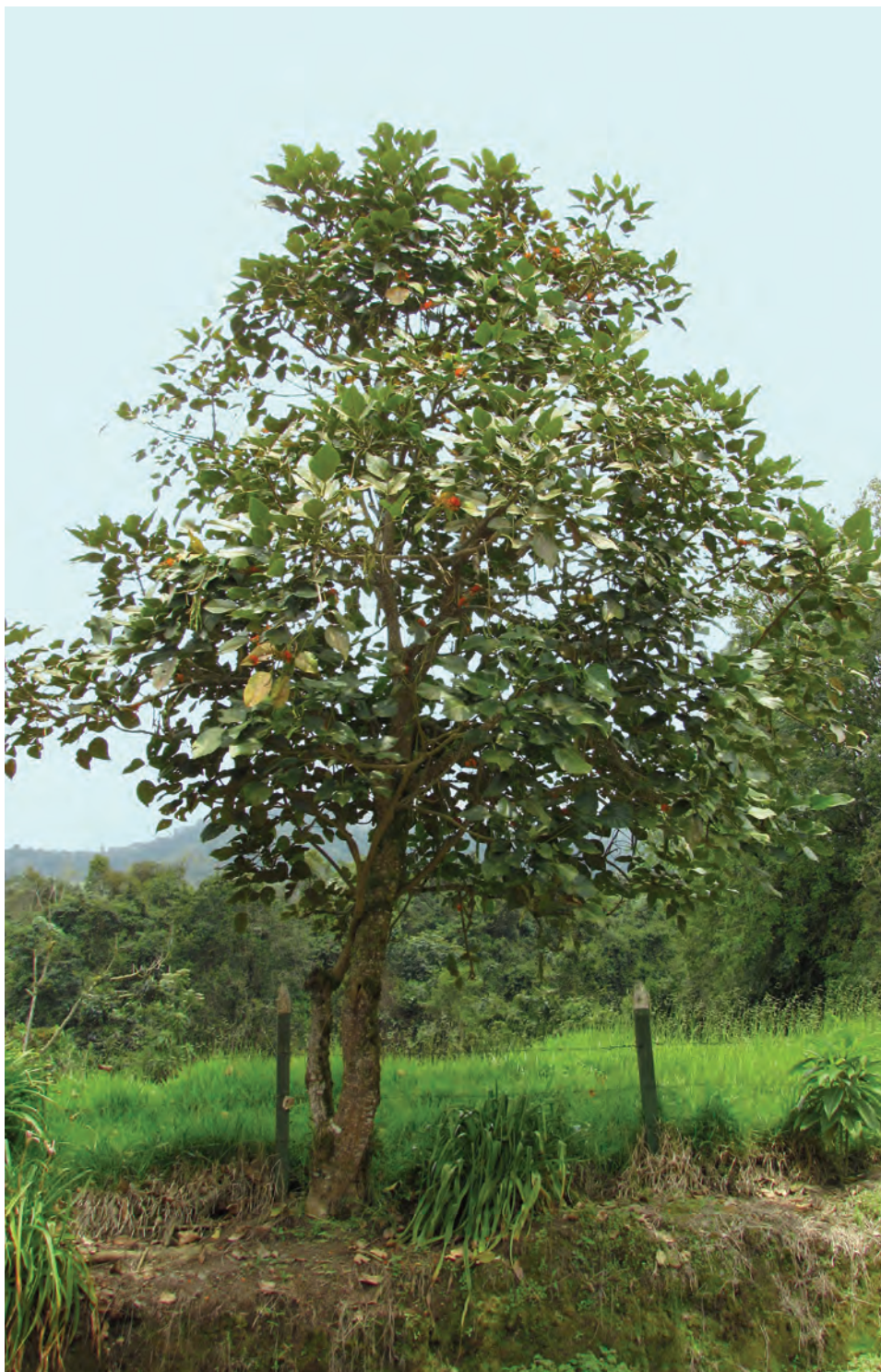
Chachafruto, ( Erythrina edulis ). [Ver galería pág. 156, 7-9]