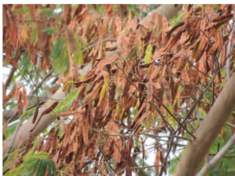
Carbonero, ( Albizia carbonaria ). [21-23] Ver pág. 88