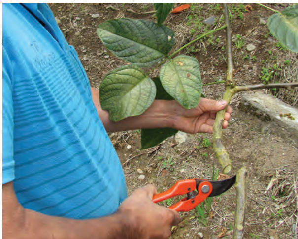
Proceso de obtención de esqueje de una rama de chachafruto ( Erythrina edulis ).

de germinación menor. Además, se recomienda tener varios individuos fuente, con el fin de tener mayor diversidad genética. Los árboles fuente deben ser preferiblemente individuos adultos, de buena talla y porte, en buen estado fitosanitario y libres de plagas, que hayan tenido varias cosechas, por lo que debe evitarse hacer la recolección de semillas en su primer ciclo de reproducción. Tradicionalmente se procura que la recolección de semillas se haga en horas de la mañana, evitando hacerlo en condiciones de mucho sol, esto se hace bajo la creencia cultural de no afectar el árbol.