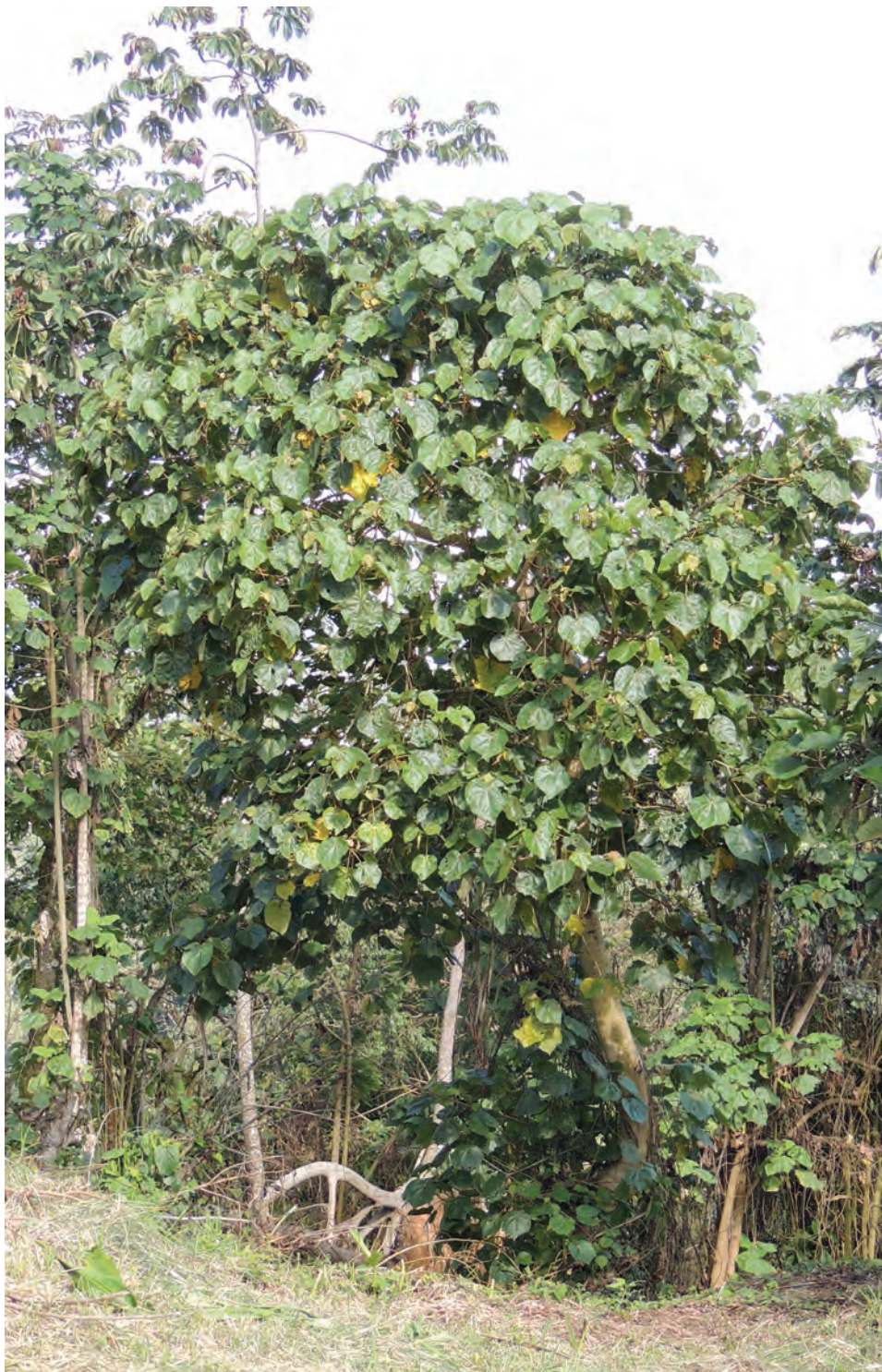
Balso blanco, ( Heliocarpus americanus sin. H. popayanensis ). [Ver galería pág. 157, 13-15]