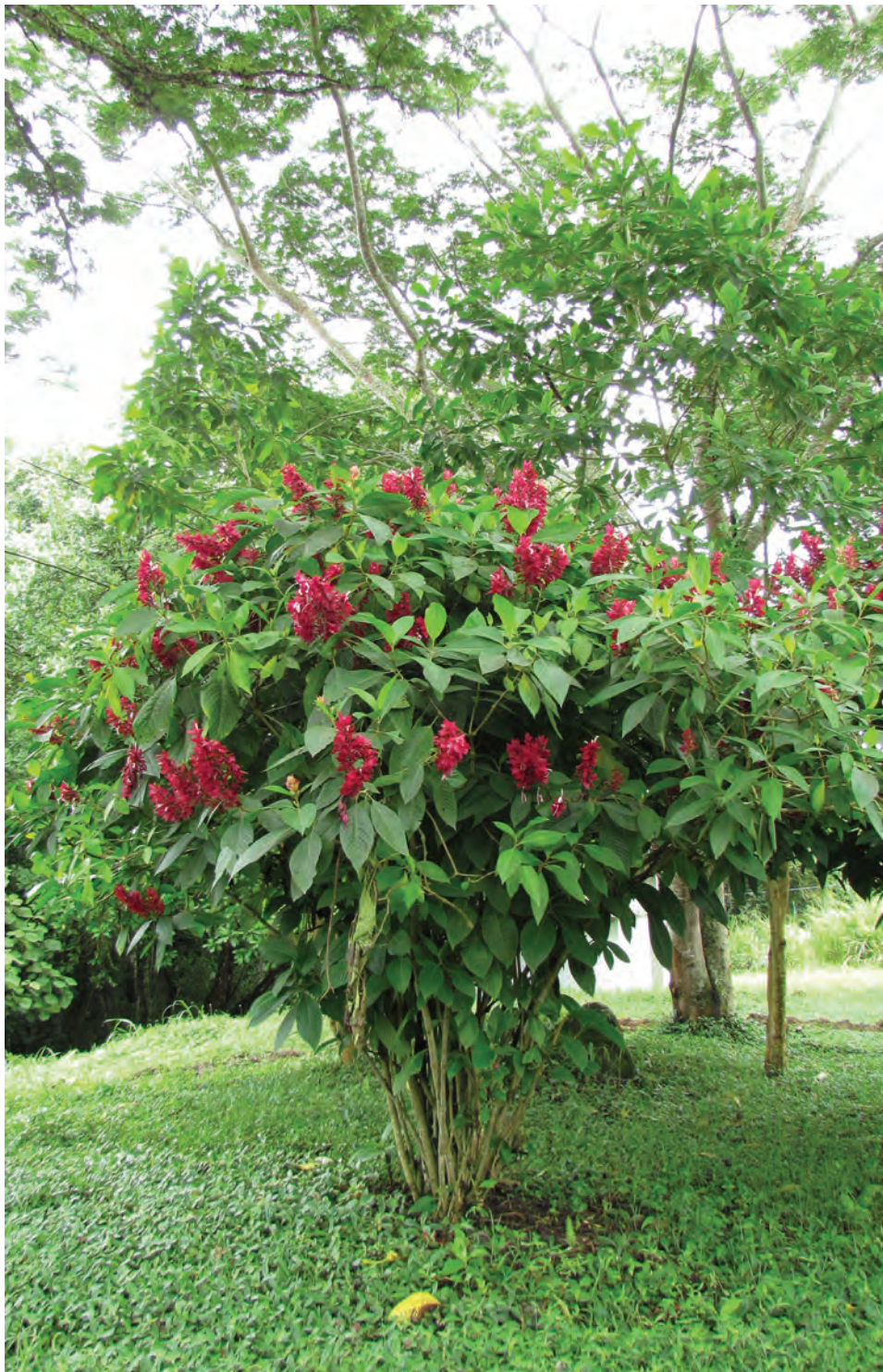
Nacadero de jardín, ( Megaskepasma erythrochlamys ). [Ver galería pág. 160, 39-40]