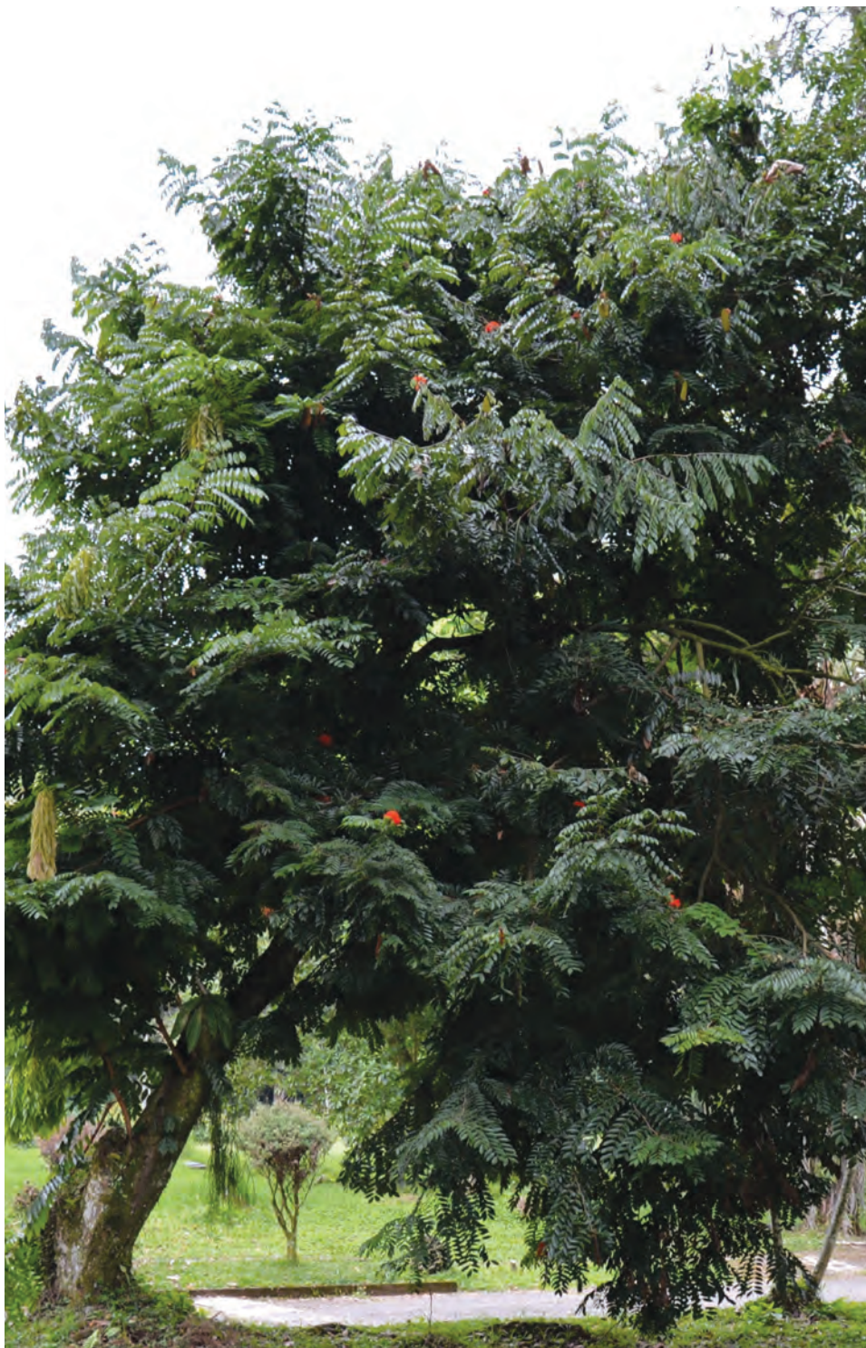
Árbol de la cruz, ( Brownea ariza ). [Ver galería pág. 163, 62-66]