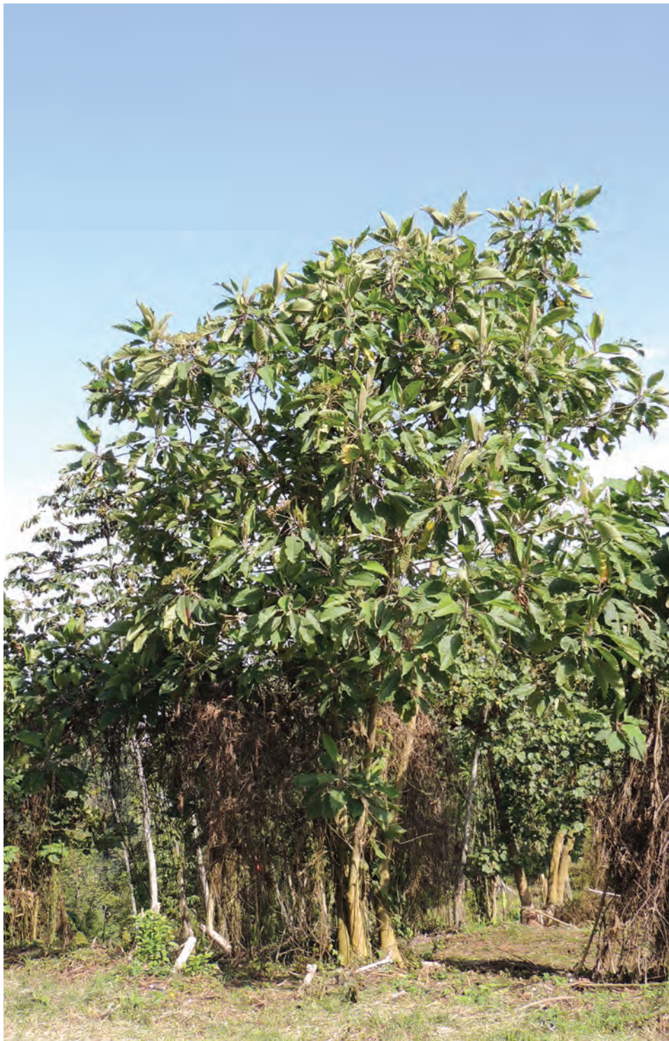
Camargo, ( Verbesina arborea ). [Ver galería pág. 164, 67-70]