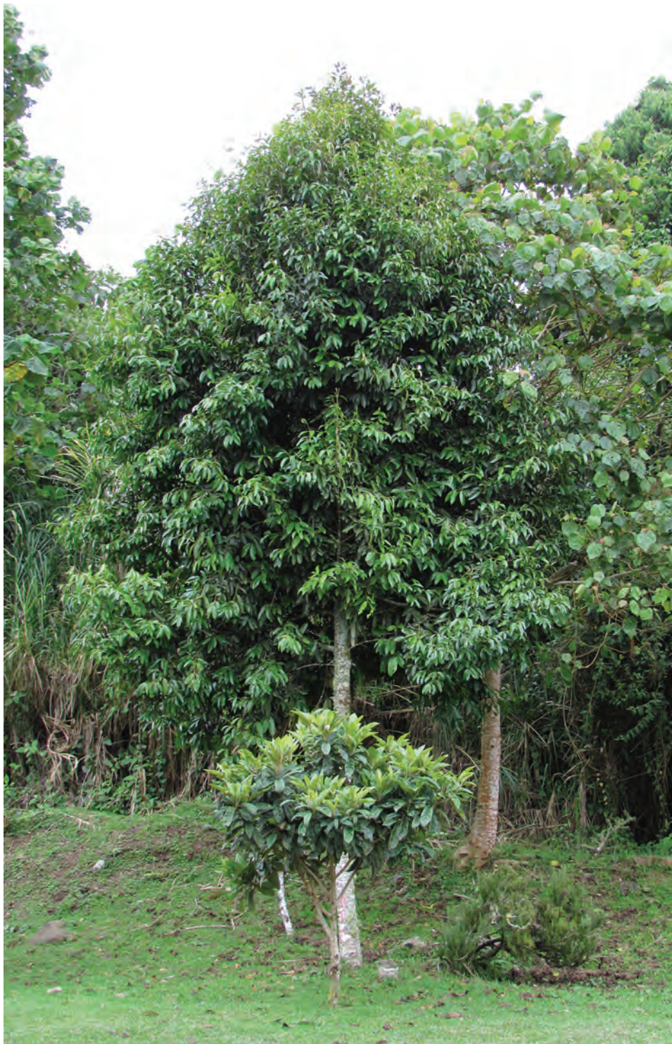
Barcino, ( Calophyllum brasiliense ). [Ver galería pág. 161, 47-49]