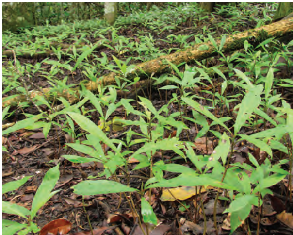
Plántulas de Caracolí ( Anacardium excelsum ) como pueden ser encontradas al lado del árbol semillero para rescate.

Se recomienda hacer una poda aérea, especialmente cuando el material presente hojas muy grandes y debe hacerse en el sitio donde se extrae la plántula para generar el estrés solo en el primer momento. Debe evitarse cargar las plántulas en la mano o transportarlas en bolsa plástica,