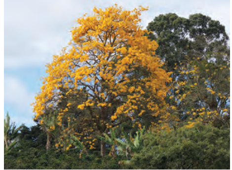
Guayacán, ( Tabebuia spp.). [41-44] Ver pág. 114