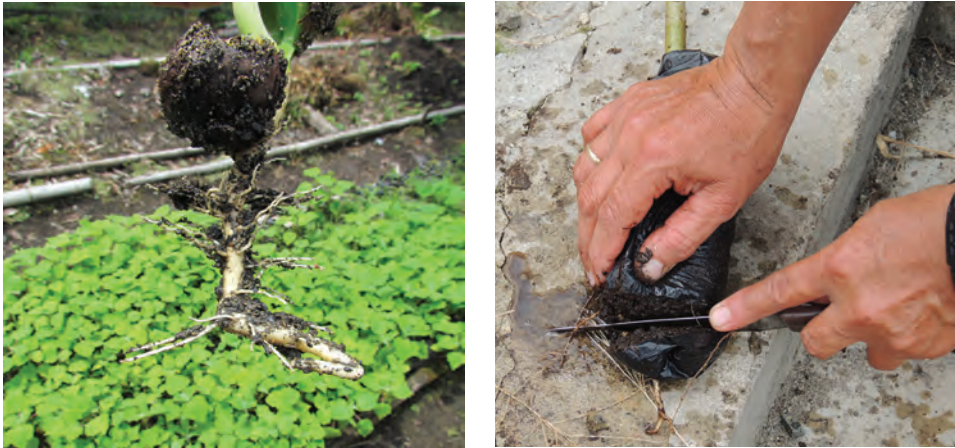
Izq. Plántula con raíz deformada. Der. Poda de raíz realizada a una plántula cuya raíz pivotante se ha salido de la bolsa y se ha deformado.

Con respecto a esta práctica, existen diferencias entre los viveristas y algunos están a favor y otros en contra de ella, prefiriendo incluso cambiar el material de bolsa antes que se presenten problemas de raíz, porque el material no pudo entregarse a tiempo. Dentro de las justificaciones para su uso, está que permite manejar bolsas más pequeñas, evita desechar material, y que de acuerdo a la especie en la que se realice la poda, no afecta el desarrollo de la planta. Sin embargo, para otros viveristas, en las plantas en las que se realiza esta poda se presenta un retraso notorio en el desarrollo en el campo y estancamiento en el crecimiento de los individuos, además de la posibilidad de que se presenten problemas de necrosis de raíz y muerte de la planta.