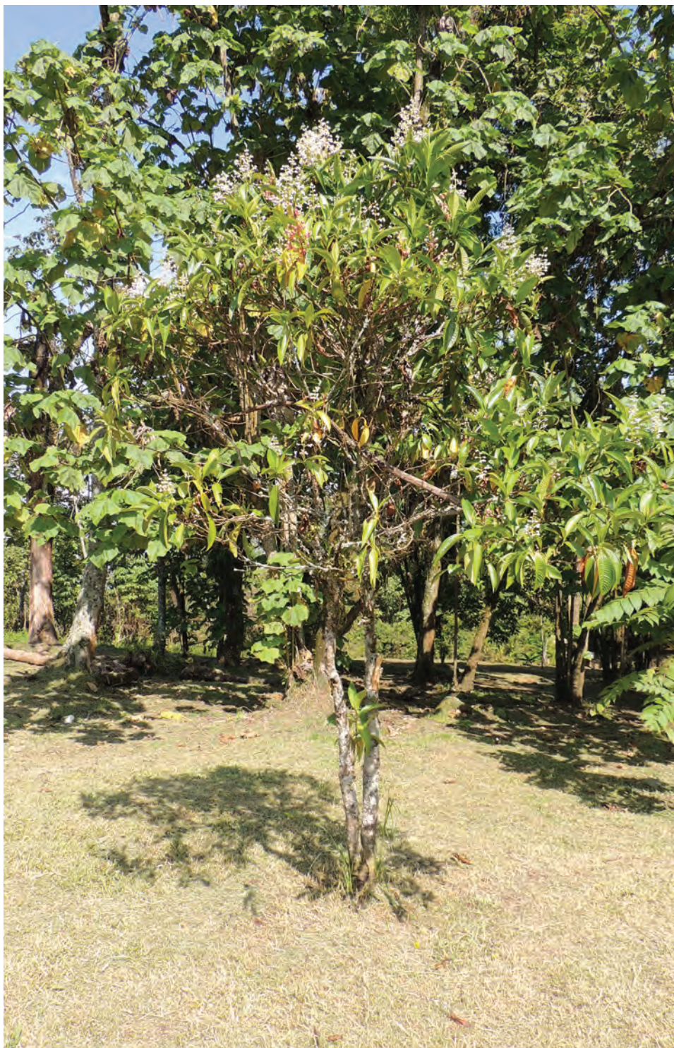
Nigüito, ( Miconia sp.). [Ver galería pág. 157, 16-20]