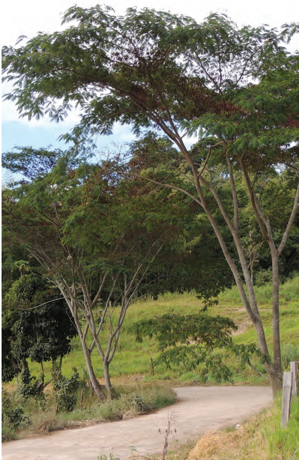
Carbonero, ( Albizia carbonaria ). [Ver galería pág. 158, 21-23]