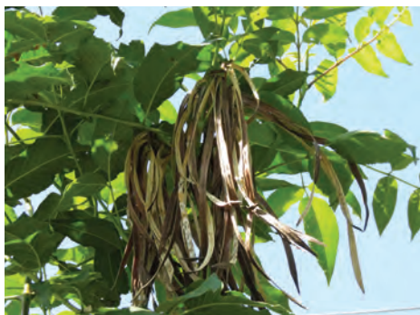
Chirlobirlo, ( Tecoma stans ). [50-54] Ver pág. 130