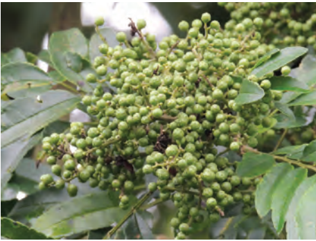
Tachuelo, doncel, ( Zanthoxylum rhoifolium Lam.). [74-77] Ver pág. 154