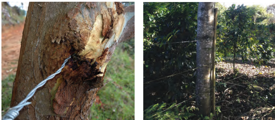
Figura 1. Izq. Daños en el árbol por fijación del alambre. Der. Forma alternativa de fijar alambre al árbol amarrando guadua flotante a él, con alambre o con caucho de neumático.