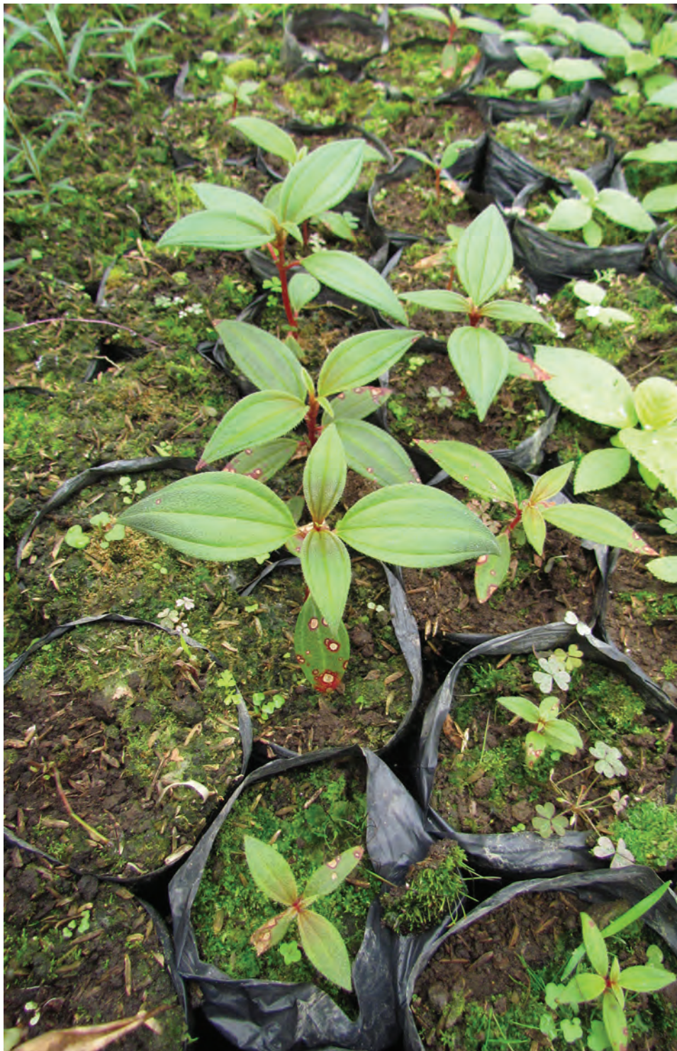
Sietecueros, ( Tibouchina lepidota ). [Ver galería pág. 158, 24-27]