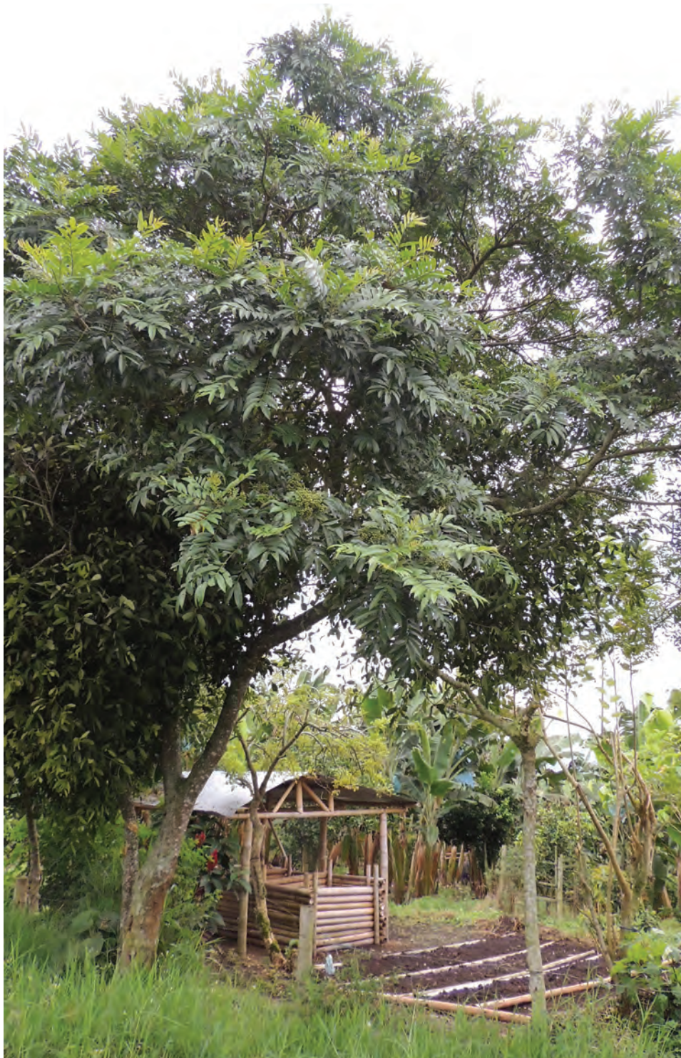
Tachuelo, doncel, ( Zanthoxylum rhoifolium Lam.). [Ver galería pág. 165, 74-77]