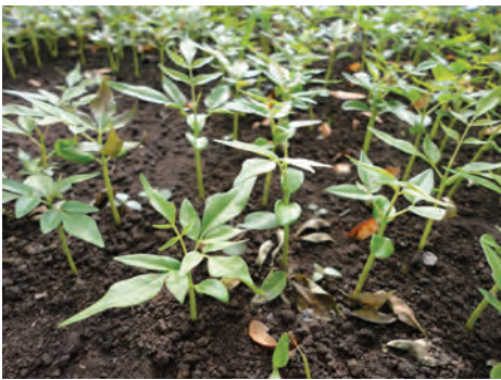
Cedro rosado, ( Cedrela odorata ). [36-38] Ver pág. 106