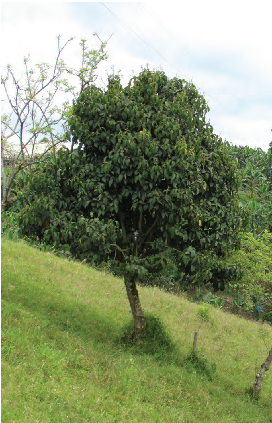
Nacedero, ( Trichanthera gigantea ). [Ver galería pág. 164, 71-73]