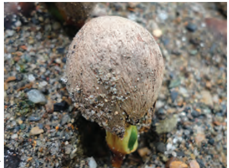
Barcino, ( Calophyllum brasiliense ). [47-49] Ver pág. 126