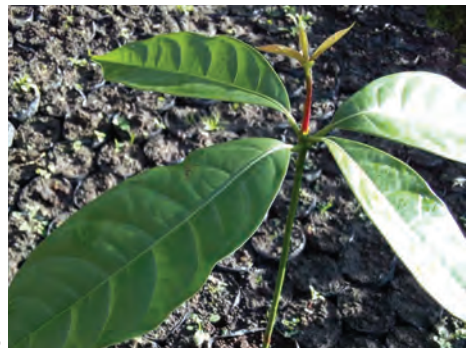
Nuquetoro, ( Persea rigens ). [45-46] Ver pág. 120