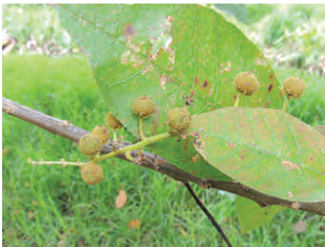
Dragos, ( Croton magdalenensis ). [28-30] Ver pág. 96