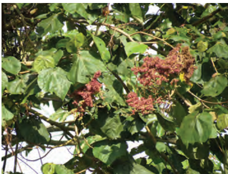
Balso blanco, ( Heliocarpus americanus sin. H. popayanensis ). [13-15] Ver pág. 78