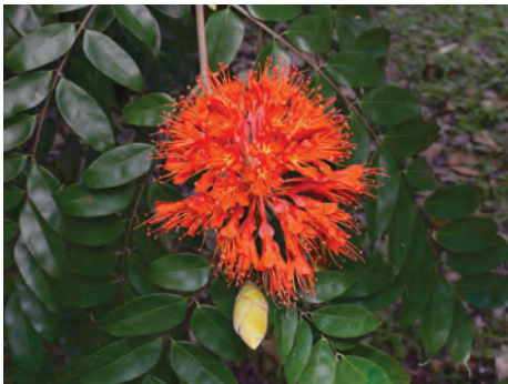
Árbol de la cruz, ( Brownea ariza ). [62-66] Ver pág. 142