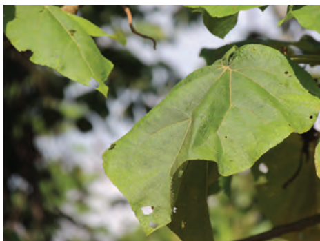
Arboloco, ( Montanoa quadrangularis ). [4-6] Ver pág. 62