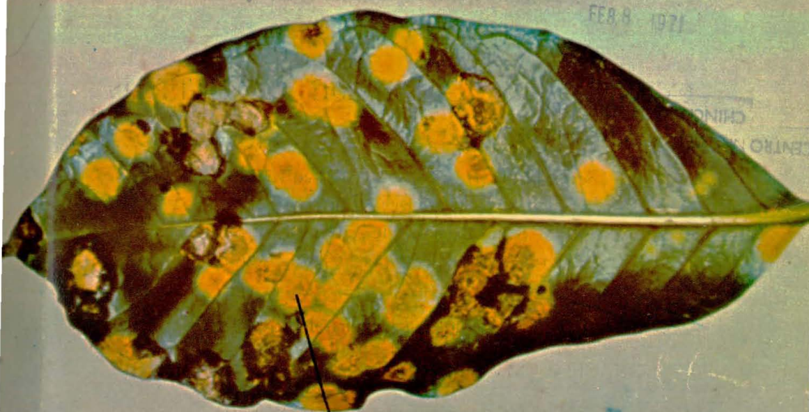
HOJA DE CAFETO ATACADA POR LA ROYA