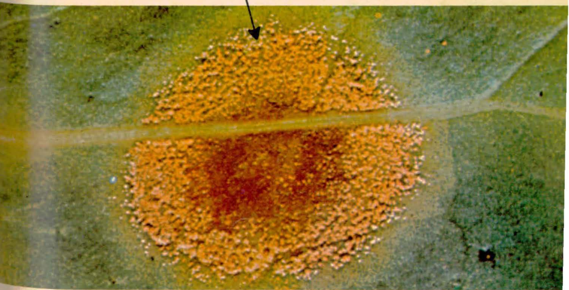
MANCHA DE ROYA - AUMENTADA