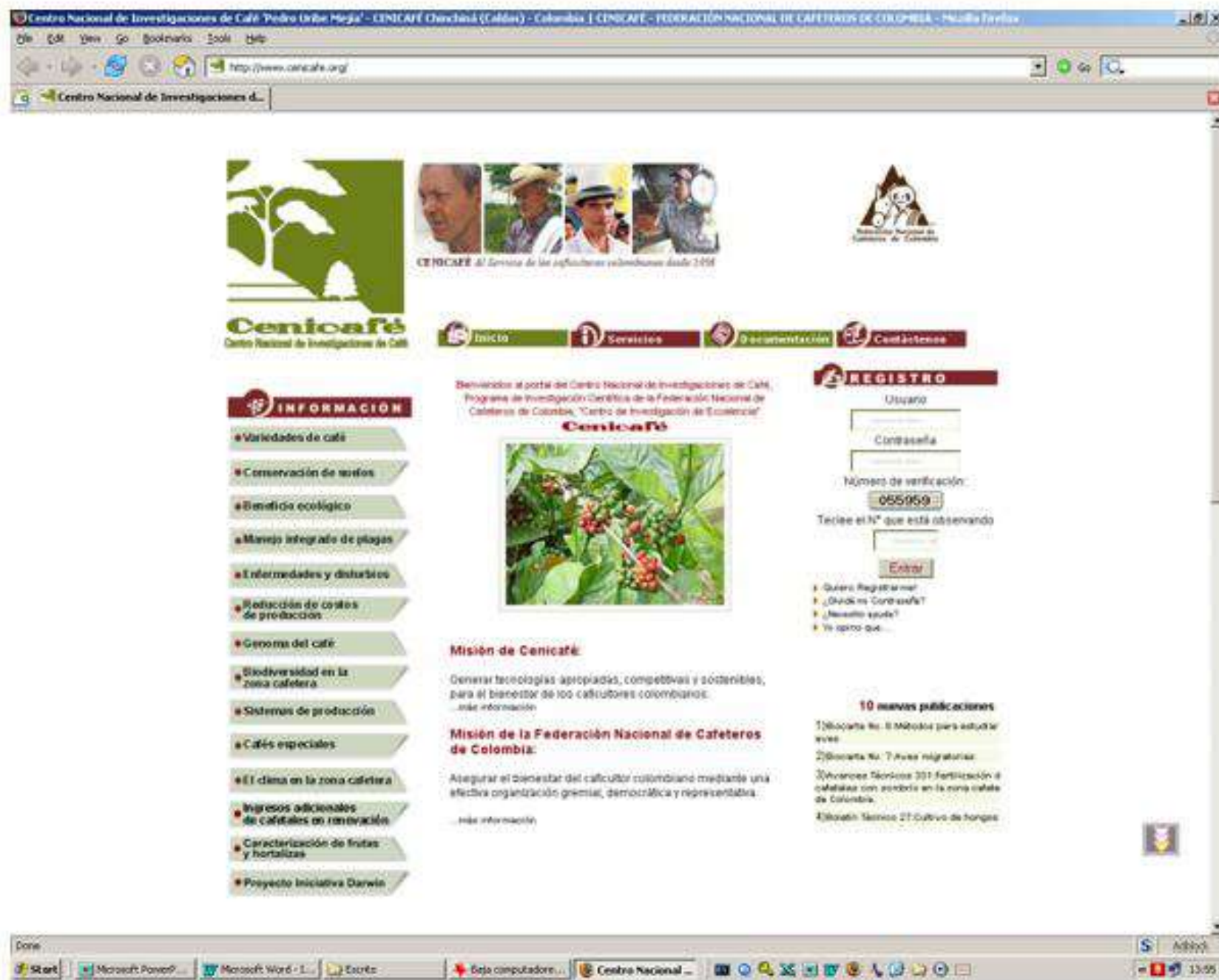
Figura 5. Portal de Cenicafé 2004